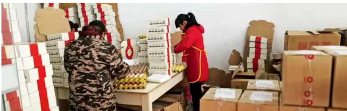
安徽石台县合作社员工正在为禾苞蛋电商平台分装土鸡蛋