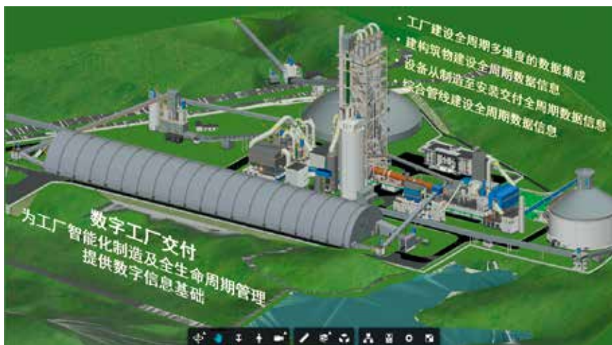
基于自主研发的工业互联网平台，为客户交付数字孪生工厂解决方案

迈入工业4.0时代，数字化、智能化是国内外水泥客户顺应时代趋势发展要求的必然选择，天津院顺势而为，