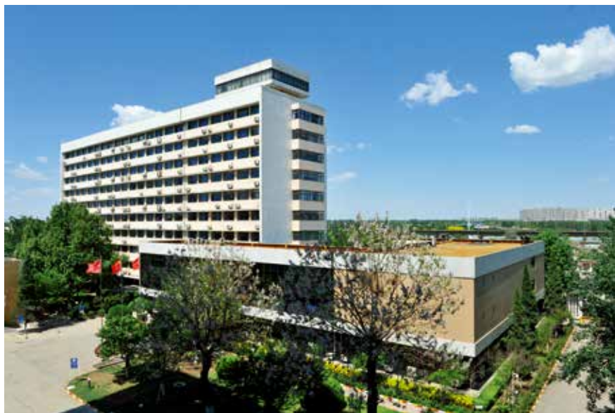
公司办公大楼全景

展，一直潜心做强中国技术和中国制造，从致力实现中国水泥的国产化、低投资，到新时代水泥工业数字化服务在国内外的落地开花，始终坚持以客户为中心，凭借先进精湛的技术、