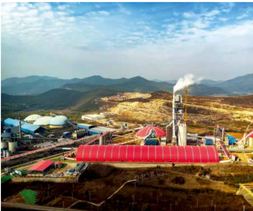
槐坎南方日产7500吨绿色化、数字化、智能化生产线：第二代新型干法生产技术应用示范线

最新技术服务集团。 水泥是集团发展的重要支撑，天津院以最新二代技术助力集团水泥企业发展，积极推进智能工厂、绿色工厂、美丽工厂建设，努力为集团水泥产业节能、降耗、提产、智能化发展作出贡献。