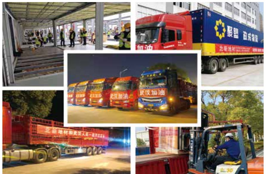
发往“小汤山”式医疗建设地板

地面的标配，产品采用双钢带压延技术，具有高密度和尺寸稳定性，有防火阻燃、抗菌防霉、易清洁等特点，非常适用于雷神山医院，为其提供了安全耐用的工作环境。