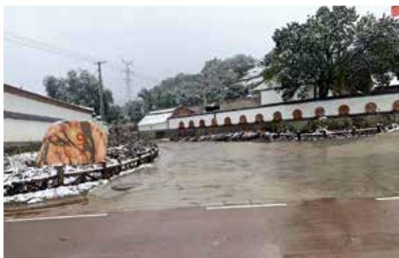
集团援建打造的宁夏泾源县杨岭村“美丽乡村建设”示范项目

习近平总书记指出：“到2020年现行标准下的农村贫困人口全部脱贫，是党中央向全国人民作出的郑重承诺，必须如期实现，没有任何退路和弹性。”