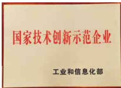
公司获国家工业和信息化部颁发的国家技术创新示范企业

历经67载的春华秋实，天津院以雄厚的科技实力，创立了中国水泥技术发展史上的无数个第一。拥有水泥