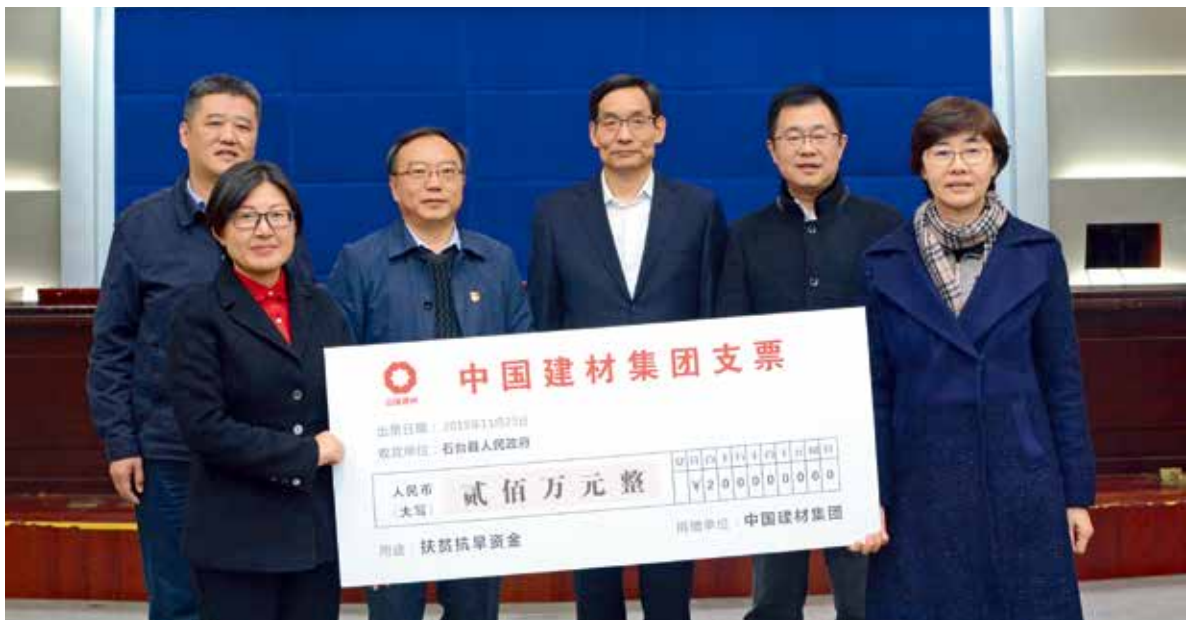
2019年11月25日,集团党委书记、董事长周育先在安徽石台县调研扶贫工作并出席捐赠仪式

党的十九大报告提出:“深入开展脱贫攻坚,保证全体人民在共建共享发展中有更多获得感,不断促进人的全面发展、全体人民共同富裕。”