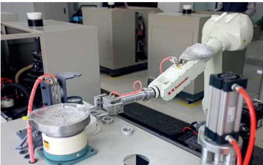
济宁中联智能取样系统

在党建引领和全体党员干部的共同努力下，目前济宁中联所有重点环保治理区域、重点部位、关键装置、重要关口环保治理区域均实现了全过程控制，实现了环保治理全方位、常态化、长效化，环保工作水平大幅提升。其