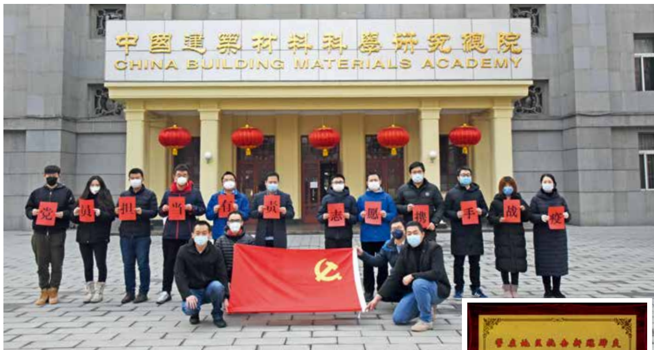
党员志愿者队伍，加强联防联控