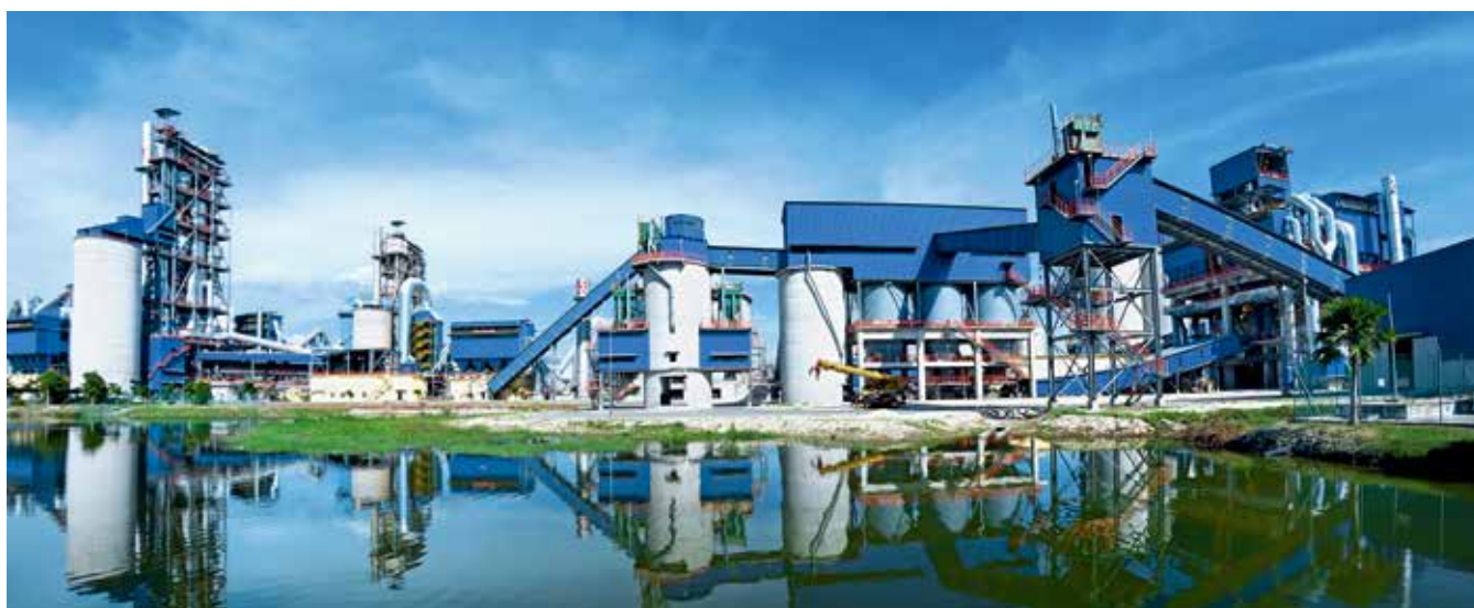
马来西亚HUME日产5000吨生产线：装备国产化率高达97%以上，所有主机设备全部天津院自给，获第十次建材行业优秀工程总包项目一等奖

时至今日，公司已经拥有了冷却机、辊压机、立磨等多项名牌产品，并以其可靠先进的技术性能获得了南方水泥、中联水泥、海螺水泥、金隅冀东、红狮集团等大客户的青睐，在国内技改市场广受好评。冷却机累计国内市场占有率超过50%；研发出的立式辊磨机被认定为“中国单项冠军示范企业产品”。