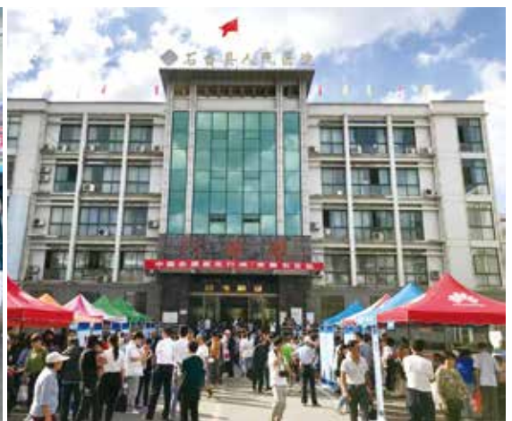
2019年9月21日，集团在安徽石台县举办志愿医生医疗扶贫活动