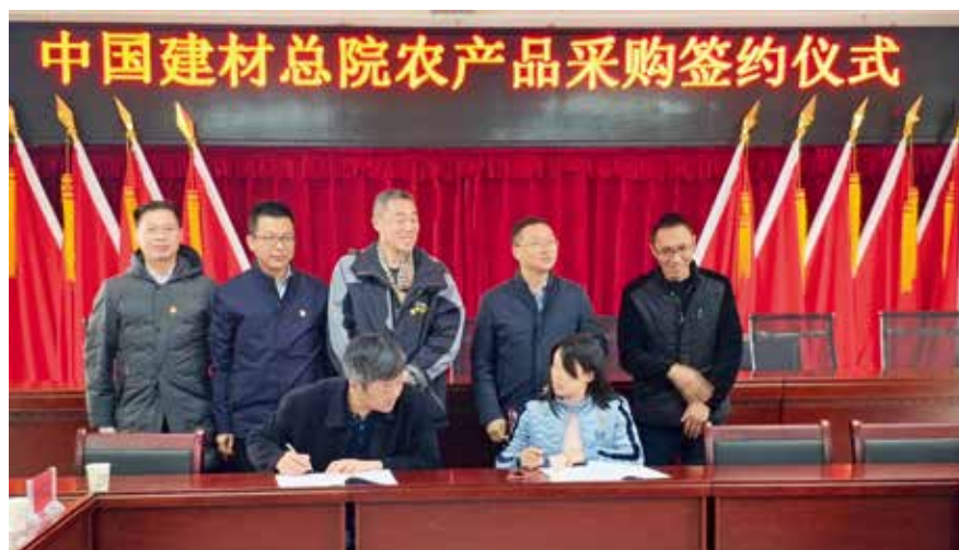
农产品采购签约仪式